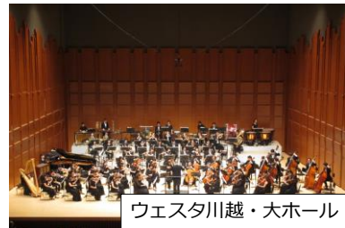
ウエスタ川越・大ホール

令和7年に開館10周年を迎える「ウエスタ川越」や観光ルート上にある「美術館」での事業、小江戸川越ハーフマラソンなど、川越の文化・スポーツの魅力的な体験型・参加型事業を、市外の方々に対しても発信し、文化・スポーツをきっかけとした川越への訪問機会を創出する事業です。