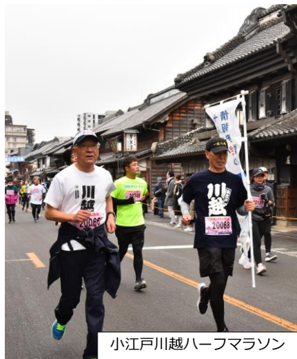
小江戸川越ハーフマラソン