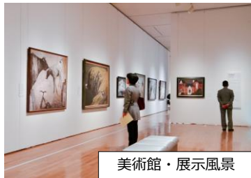
美術館・展示風景