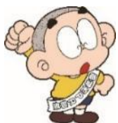
都城市PRキャラクター兼 PR部長「ほんちくん」

「妊娠期から子育て期まで切れ目ない経済的支援」を実施し、 安心して子育てできる『子育て三ツ星タウン』を目指しています。 子どもを産み育てたいと思う方へのサポートのために、皆様方 のご支援をお願いいたします。