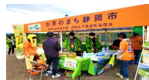
お茶啓発イベント