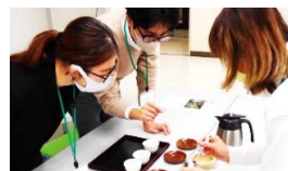
お茶を学ぶ市民向け講座