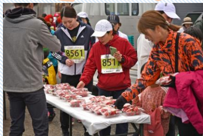
横島いちごマラソン大会