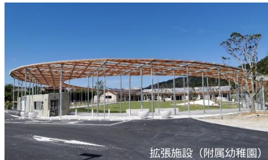
拡張施設（附属幼稚園）

鋸南保田IC降りてすぐに位置し、平成27年供用開始。年間約80万人が訪れる道の駅で、令和5年10月に施設の拡張を行いました。「日本遺産候補地域」の鋸山との連携、多様な世代が集い、心地よく過ごせる施設を目指して、遊具やフルーツの収穫などを楽しめる公園を整備します。