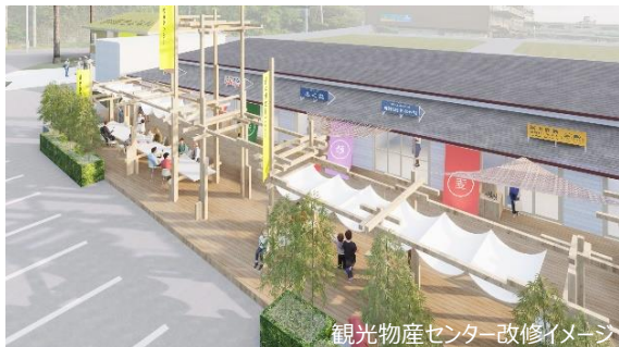
観光物産センター改修イメージ

国道127号沿いに位置し、昭和60年供用開始（道の駅登録は平成8年）。築38年の鋸南町観光物産センターは、テナントとして6店舗が入居し、地域の魅力発信に挑戦する事業者の活躍の場としての機能を担ってなっています。今後も更なる経済の活性化を推進するため、観光物産センターの改修を行います。