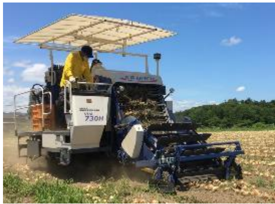
農業再生を通じた「人」「地域」づくり