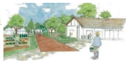
【公園内部 整備イメージ】